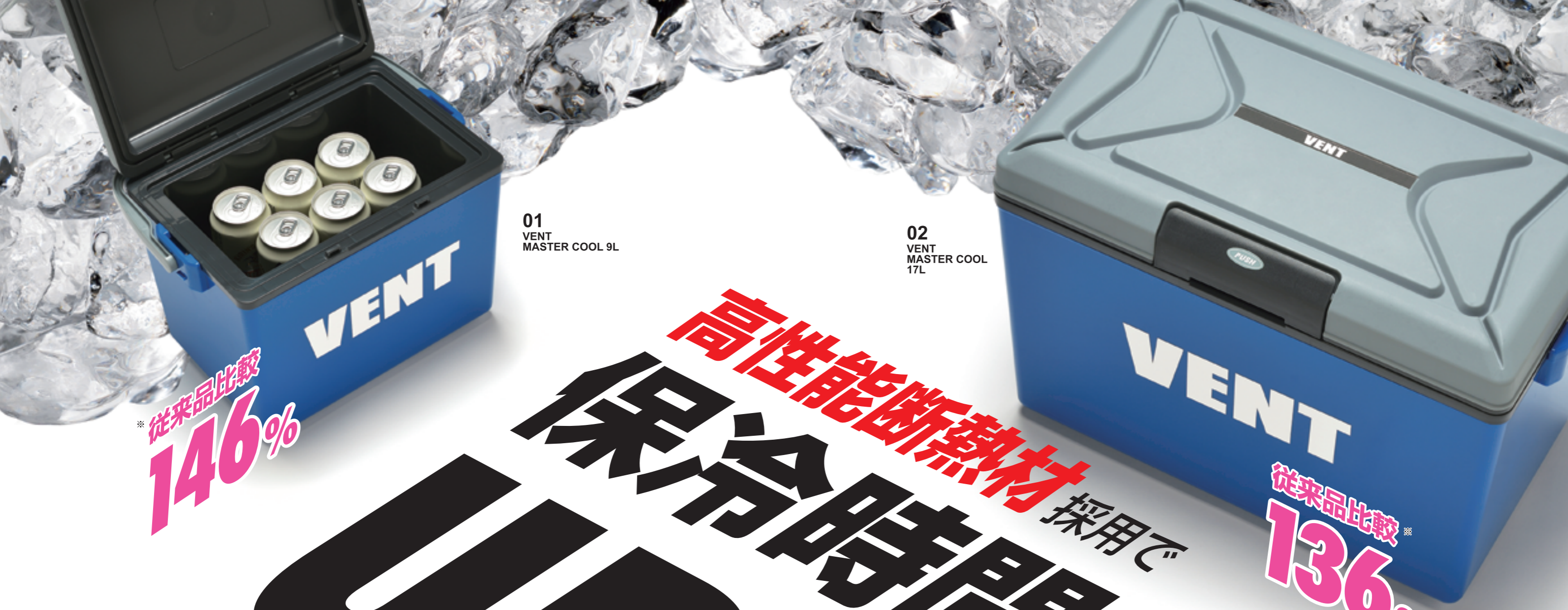
01 VENT MASTER COOL 9L